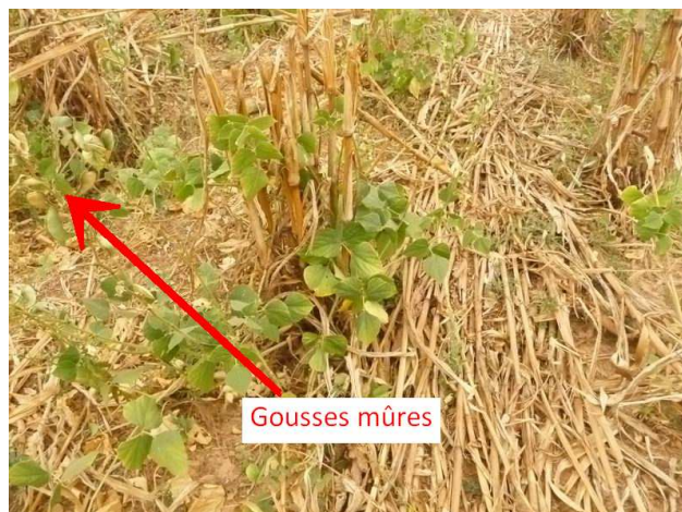
Dolique en janvier 2011

Une partie de la dolique a été pâturée en janvier ; l'autre partie servira à produire des semences.